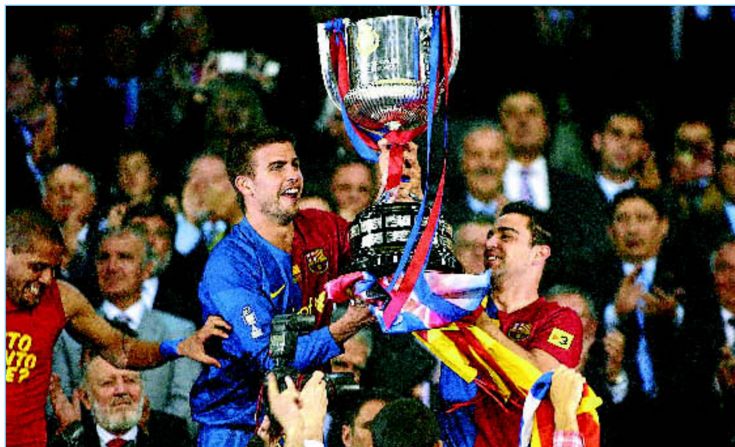
Xavi y Piqué levantan la Copa que les acredita como campeones. Los canteranos no podían ocultar su enorme alegría