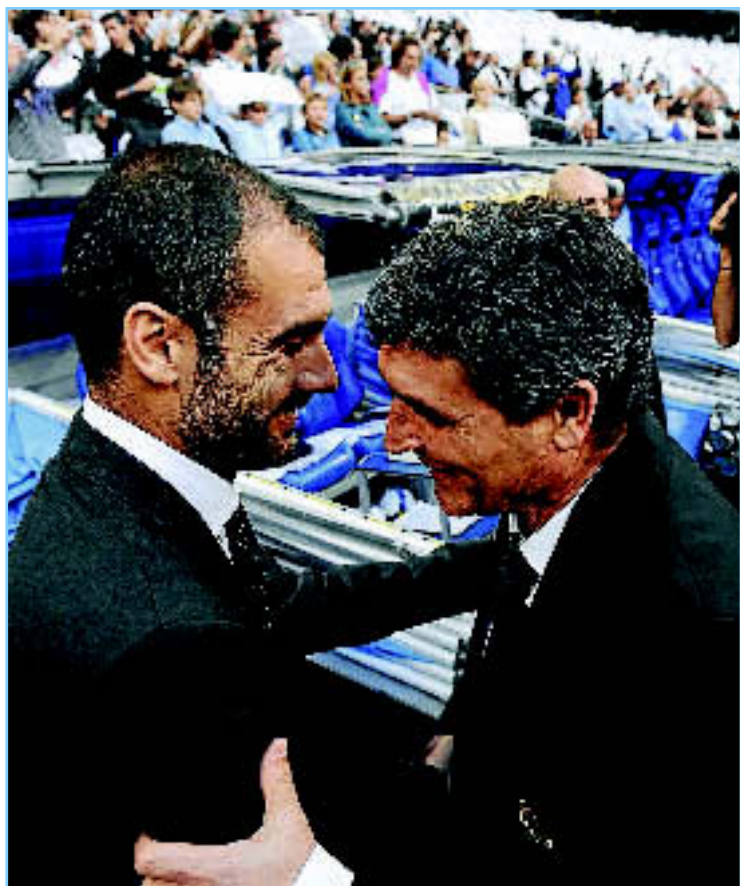
Guardiola saluda a Juande Ramos antes del encuentro